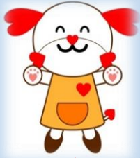
三田市人権を考える会 マスコットキャラクター 「ラブピース」